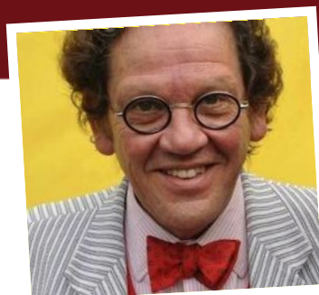
Philippe Daverio Il paesaggismo italiano