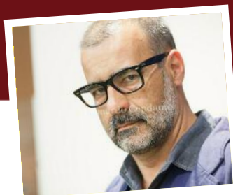
Luca Beatrice La fotografia, Le nuove tendenze espressive