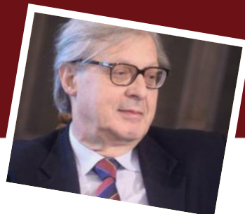
Vittorio Sgarbi L'arte figurativa