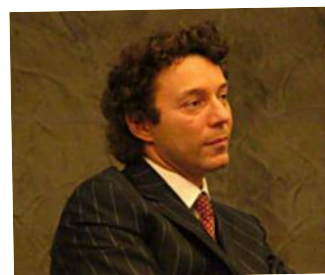
Sandro Serradifalco l'Astrazione e l'informale